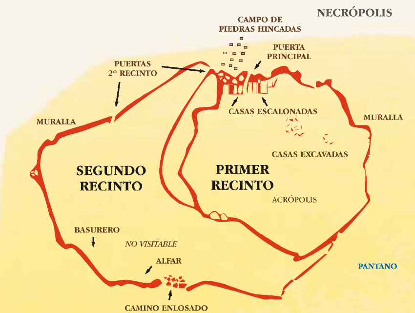
Planta del Castro.

Están compartimentadas en el interior y en la mayoría se describe una zona de barro endurecido que se ha identificado con el hogar. Son muy características de este poblado las casas escalonadas que se encuentran junto a la muralla en las proximidades de la puerta principal y que suponen la adaptación del terreno a las necesidades constructivas.