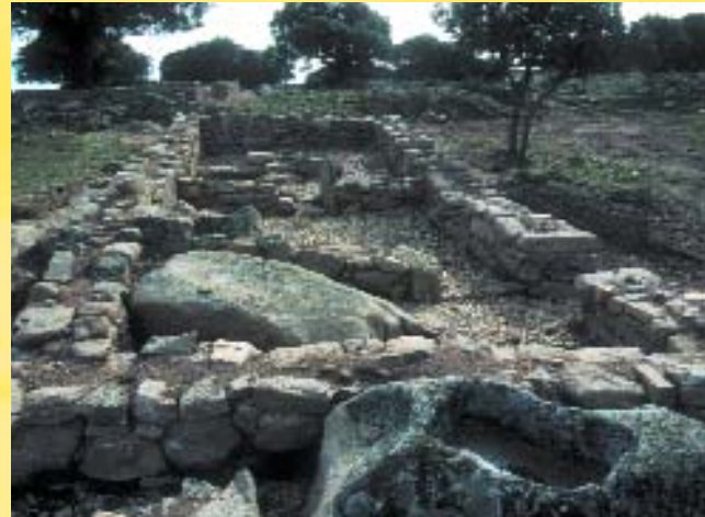
Cillán. Los Herrenes de San Cristóbal.

El castro de La Mesa de Miranda constituye por sí mismo y por el amplio entorno paisajístico en que se encuentra, una magnífica excursión para conocer la historia y el paisaje de la vertiente norte de la Sierra de Ávila. Por tratarse de una zona tradicionalmente con recursos limitados se ha conservado bastante bien, tanto en su paisaje original como en la arquitectura popular. Merece la pena recorrer algunos de los pueblos del entorno de Chamartín y moverse sin planes previos por su paisaje agreste, pero atractivo, donde el granito provoca ambientes evocadores. El yacimiento arqueológico de los Herrenes de San Cristóbal, la necrópolis rupestre medieval y alto medieval de La Coba, el pueblo de San Juan del Olmo o las de Ermitas de Rihondo y de las Fuentes son referencias complementarias para planificar una ruta con el castro de La Mesa de Miranda como pretexto principal.