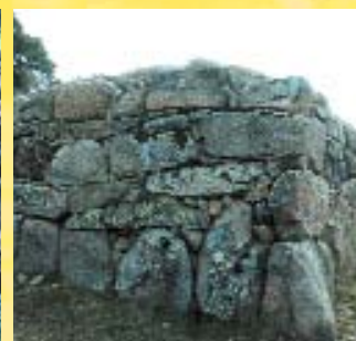
Muralla del tercer recinto.