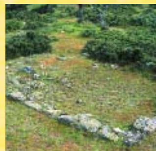
Zócalo de una casa en el primer recinto.

El primer recinto es el más antiguo y el más grande (11,5 ha), donde previsiblemente vivió el grueso de la población. Estaba todo amurallado. La adaptación de la muralla a la topografía abrupta del sitio es un claro exponente del estereotipo de un castro vetton. En la parte sur, donde la muralla alcanza los 5 m de ancho, tiene dos puertas flanqueadas por torres circulares y defendidas por campos de piedras hincadas y un foso, colmatado por el derrumbe de la muralla. Una de las puertas fue cegada de antiguo, se supone que para evitar menos puntos vulnerables. La muralla en este punto se compone de muralla y antemuralla, como un sistema defensivo más.