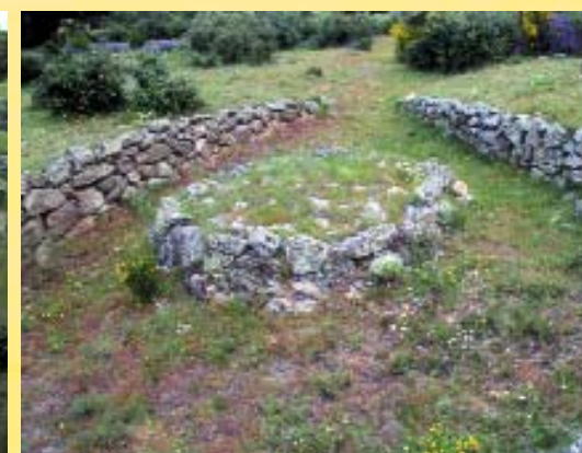
Túmulo encerrado dentro de una estructura.