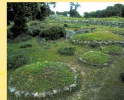
Túmulos dentro del tercer recinto.

La necrópolis estaba dividida en seis zonas bien definidas unas de otras y presididas por un hito de piedra vertical. Tal cosa es posible que obedezca a la división en linajes o castas que componía la sociedad del castro. Estudios recientes han puesto de manifiesto que los hitos que presiden cada una de las zonas en que se divide la necrópolis guardan la misma alineación que la constelación celeste de Orión, circunstancia que estaría indicando detalles de las creencias en el más allá que tenían los habitantes de La Mesa de Miranda.