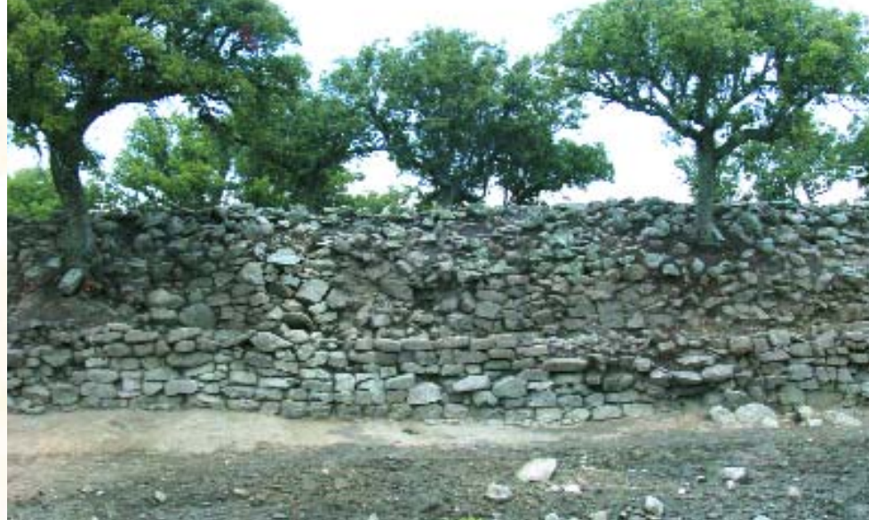
Lienzo sur del primer recinto.

La Mesa de Miranda fue un castro habitado por vettones entre finales del siglo V y el siglo I a.C. Según las fuentes romanas, el pueblo vetton ocupaba las actuales provincias de Ávila, Salamanca, Cáceres, parte de la de Toledo y norte de la de Badajoz. Los datos más abundantes sobre los vettones los ha aportado la arqueología. Las referencias antiguas no son muy abundantes. Con frecuencia les sitúan en los momentos previos y durante la conquista romana, aliados, sobre todo, con los lusitanos. Con éstos se les cita asaltando ciudades del valle del Guadalquivir o atacando a las tropas romanas durante las Guerras Celtibéricas (155-133 a.C.). Finalmente serán sometidos a partir del 133 a.C., aunque vuelven a ser citados tomando partido por alguno de los contendientes en las guerras civiles romanas que durante el siglo I a.C. se libran en territorio hispano. El castro de La Mesa de Miranda debió ser abandonado, bien hacia el 133 a.C. o, más probablemente, al final de las guerras civiles, cuando se lleva a cabo la estructuración de Hispania por Augusto, como parte del Imperio Romano.