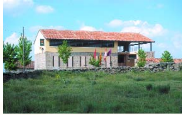
Chamartín. Aula arqueológica.

Como complemento a la visita del castro existe un aula arqueológica en el pueblo de Chamartín que contribuye a la explicación del castro y al contexto histórico del que formó parte. Se compone de dos estadios: el de la vida material, instalado en el primer piso y el del mundo de las creencias, en el segundo piso. La vida material está explicada con maquetas, ordenadores táctiles, reproducciones y paneles. Las creencias se explican en el piso superior con audiovisuales, maquetas y paneles. Hay también un apartado dedicado a las esculturas zoomorfas, de las que han aparecido en el castro y sus inmediaciones varias, una de ellas, representando a un toro, se encuentra en la plaza de Chamartín y otras dos, incompletas, en el aula arqueológica y en el castro respectivamente. El aula arqueológica se abre, sobre todo, los fines de semana.