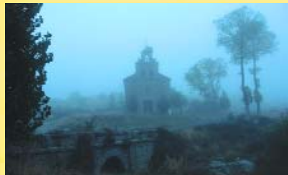
Ermita de Rihondo.

El castro de La Mesa de Miranda constituye por sí mismo y por el amplio entorno paisajístico en que se encuentra, una magnífica excursión para conocer la historia y el paisaje de la vertiente norte de la Sierra de Ávila. Por tratarse de una zona tradicionalmente con recursos limitados se ha conservado bastante bien, tanto en su paisaje original como en la arquitectura popular. Merece la pena recorrer algunos de los pueblos del entorno de Chamartín y moverse sin planes previos por su paisaje agreste, pero atractivo, donde el granito provoca ambientes evocadores. El yacimiento arqueológico de los Herrenes de San Cristóbal, la necrópolis rupestre medieval y alto medieval de La Coba, el pueblo de San Juan del Olmo o las de Ermitas de Rihondo y de las Fuentes son referencias complementarias para planificar una ruta con el castro de La Mesa de Miranda como pretexto principal.