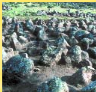
Segundo recinto. Detalle del campo de piedras hincadas.

A partir de la factura de las murallas que componen los tres recintos, se deduce que no fueron contemporáneos. El sistema defensivo fue perfectamente estudiado para que no hubiera puntos vulnerables, a la vez que adaptado a la morfología favorable del terreno.