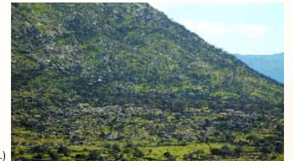
Plataforma de Las Paredejas. (R.D.)

Según las fuentes antiguas, en esta zona habitaban los vettones, un pueblo de cultura céltica del que las crónicas hablan que estaba aliado a sus vecinos lusitanos en las luchas contra los romanos. No se sabe nada de su lengua puesto que no practicaban la escritura. Vivían en lugares de fácil defensa, con varios recintos fortificados complementarios, su sociedad estaba fuertemente jerarquizada e incineraban a sus muertos guardando las cenizas en vasijas que enterraban en el suelo.