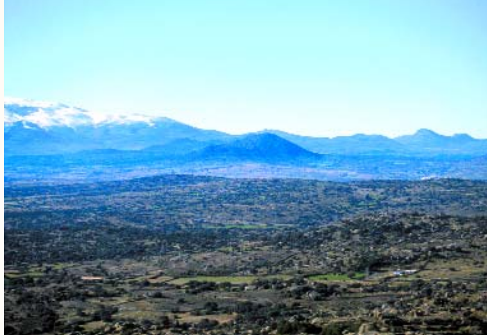
Cerro del Berrueco desde el este.

En este yacimiento no se han hecho excavaciones hasta el momento con la suficiente entidad, por lo tanto no existe una oferta monumental para el visitante. La visita debe responder al deseo de conocer un lugar antiguo con una historia importante entre su espacio, en un ambiente natural tranquilo y representativo de esta zona de La Meseta.