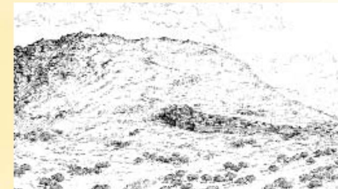
Reconstrucción del ambiente en el castro en el siglo II a. C. (Dibujo de Miguel Sobrino)

La dispersión de los restos en unas 50 ha, implica, por más que no sea la real, que este castro tuvo unas dimensiones a la altura de los que pueden considerarse de tamaño medio en la zona en torno a Ávila.