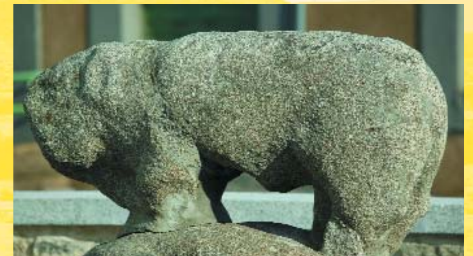
Verraco de Las Paredejas en Puente del Congosto. (R.D.)

Constaba de un recinto que puede decirse urbano y de una necrópolis, desmantelada prácticamente por las tareas agrícolas y por el furtivismo que ha asolado a todo el Cerro del Berrueco.