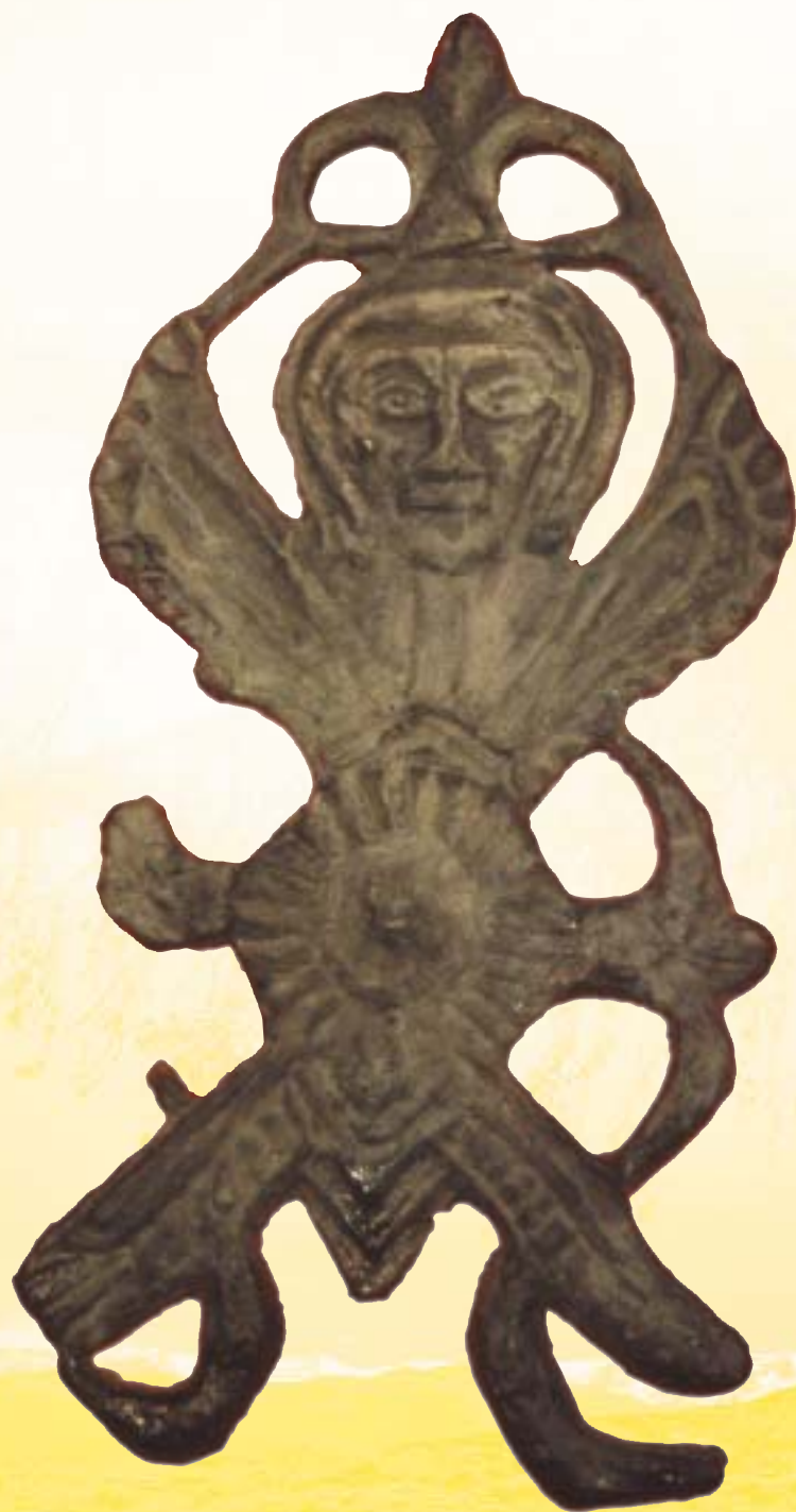
Representación en bronce de la diosa Astarté.

Como en todos los castros vettones, hubo de conocer grandes vicisitudes, sobre todo entre los siglos III y I a.C. En ese tiempo tuvo lugar algún conflicto con los ejércitos cartagineses y, sobre todo, la conquista romana, que terminó con su dominación. Las llamadas Guerras Celtibéricas (155-133 a.C.) implicaron su sometimiento a Roma y, después, su posicionamiento por una de las facciones en lucha durante las guerras civiles del siglo I a.C. hubieron de implicar su decadencia final, para abandonarse previsiblemente hacia finales del siglo I a.C. o ya en el siglo I d.C.